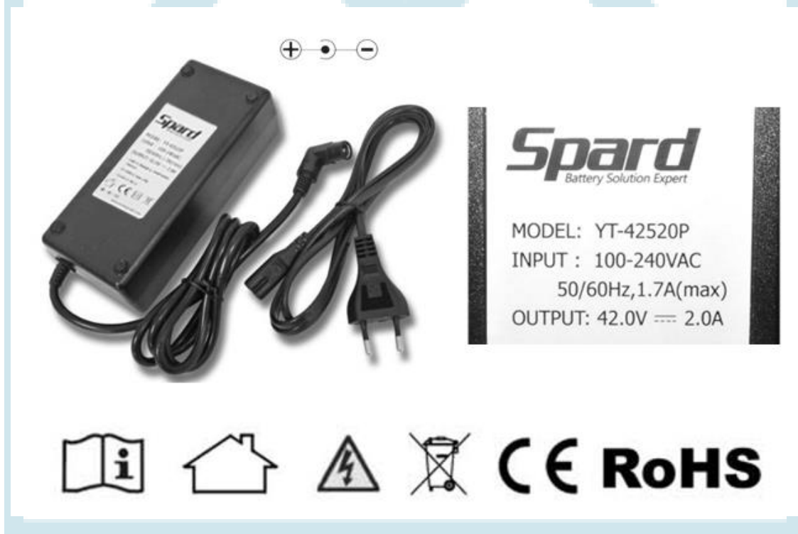
immagine a scopo illustrativo. Il caricabatteria reale potrebbe differire esteticamente